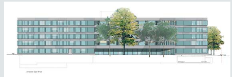
Südwestfassade mit Blick auf den Innenhof